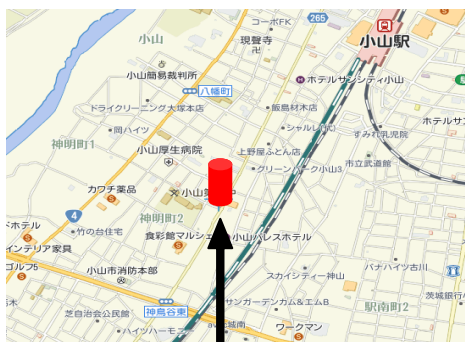
ジョブカレッジ栃木小山校(株)プラスワーク